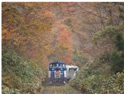
紅葉のトンネルを走り抜けるトロッコ列車。県境が近づくとつれて木々も色づいてきます。