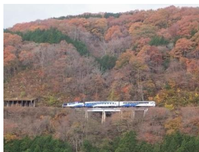
出雲坂根駅を出て2度目の方向転換を終え、県境を目指す列車。国道314号の道の駅から撮影。