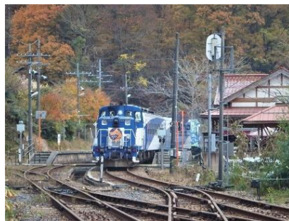
出雲坂根駅に到着。この駅で進行方向を変えて坂を登り、さらにもう一度進行方向を変えて峠を越えます。この駅の延命水は乗客の喉を潤します。