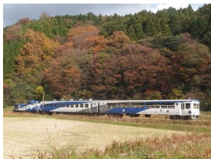
稲の刈入れも終わり、色づいた木々をバックに走るトロッコ列車。

備後落合駅は、かつては宍道・松江、三次・広島、新見・岡山方面の乗り換えのために多くの乗客で賑わったそうですが、今は広い構内だけが目立つがらんとした駅になってしまいました。3方面からの線路が接続するジャンクションでありながら、この駅に列車が顔を出すのは1日10回程度、しかも「奥出雲おろち号」を除くと1両だけのワンマン列車ばかりです。中国山地を走るローカル線の衰退ぶりを実感する駅ですが、トロッコ列車の発着の際は一時的に駅に賑わいが戻り、奥出雲の自然を感じられる木次線とともに観光資源としていつまでも残ってほしいとローカル線を愛する筆者は願っています。